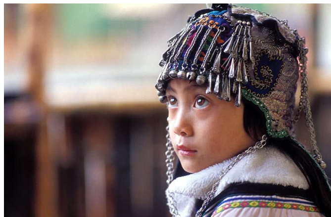
Les minorités Ethniques