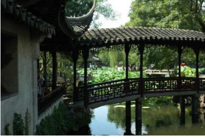
Sūzhōu ( la Venise de l'Orient )