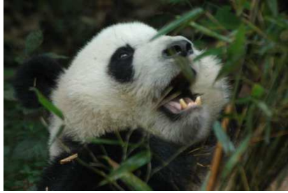
Chéngdū et ses pandas