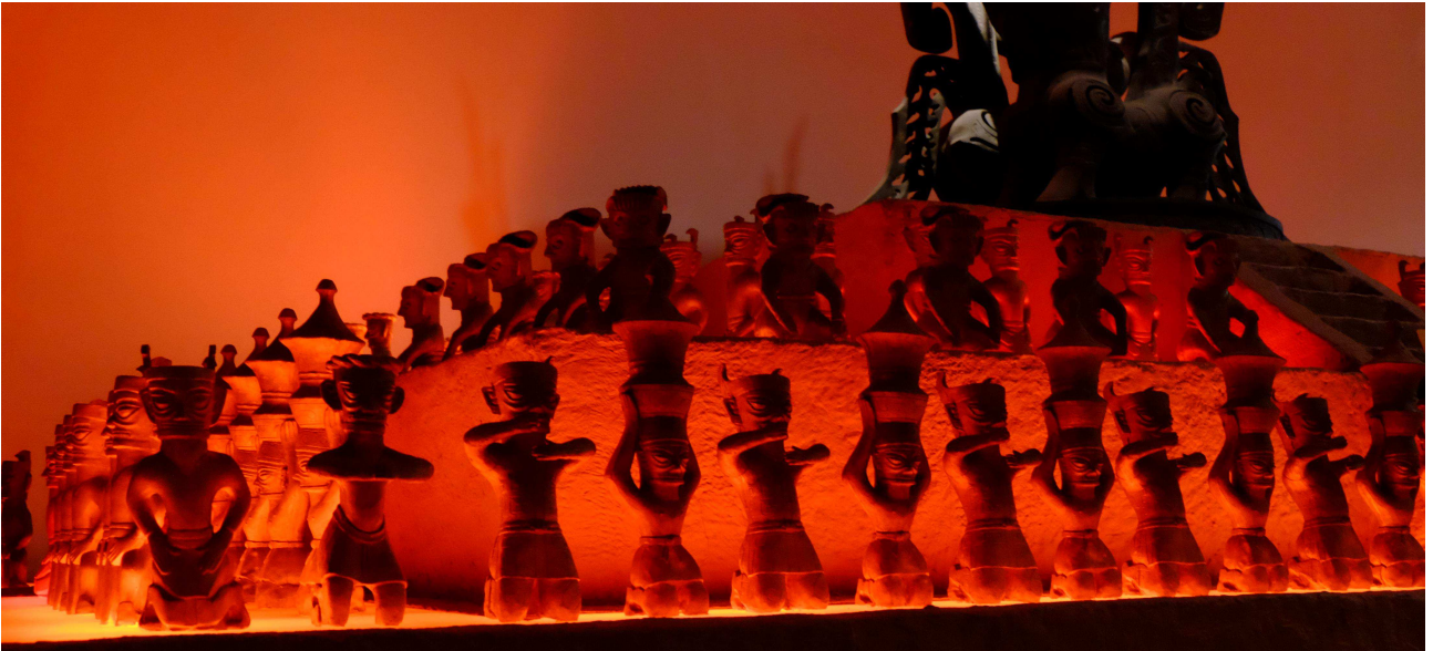
Les statues en pied dans la position debout ou agenouillée