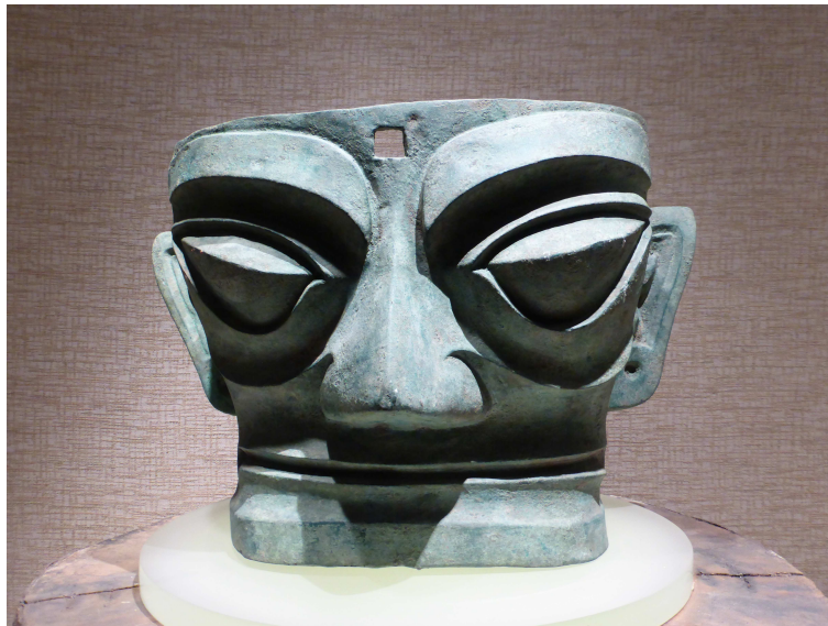
Masque de tête humaine en bronze, fin dynastie des Shang, 25,5cmx42,5cm