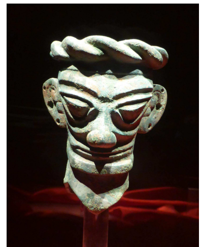
Tête d'homme en bronze coiffée d'une couronne tressée, fin de la dynastie des Shang, 13,7 cm