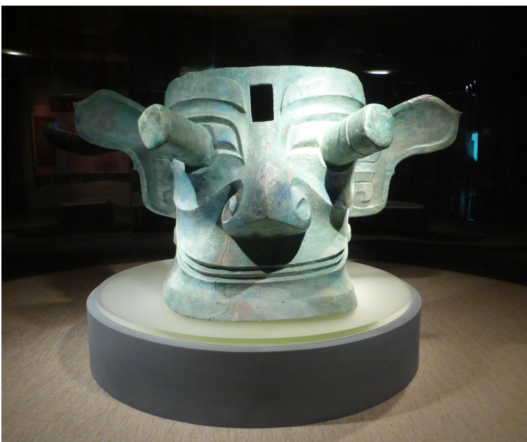
Le masque de tête animale en bronze, fin de dynastie des Shang, 65cmx138cm