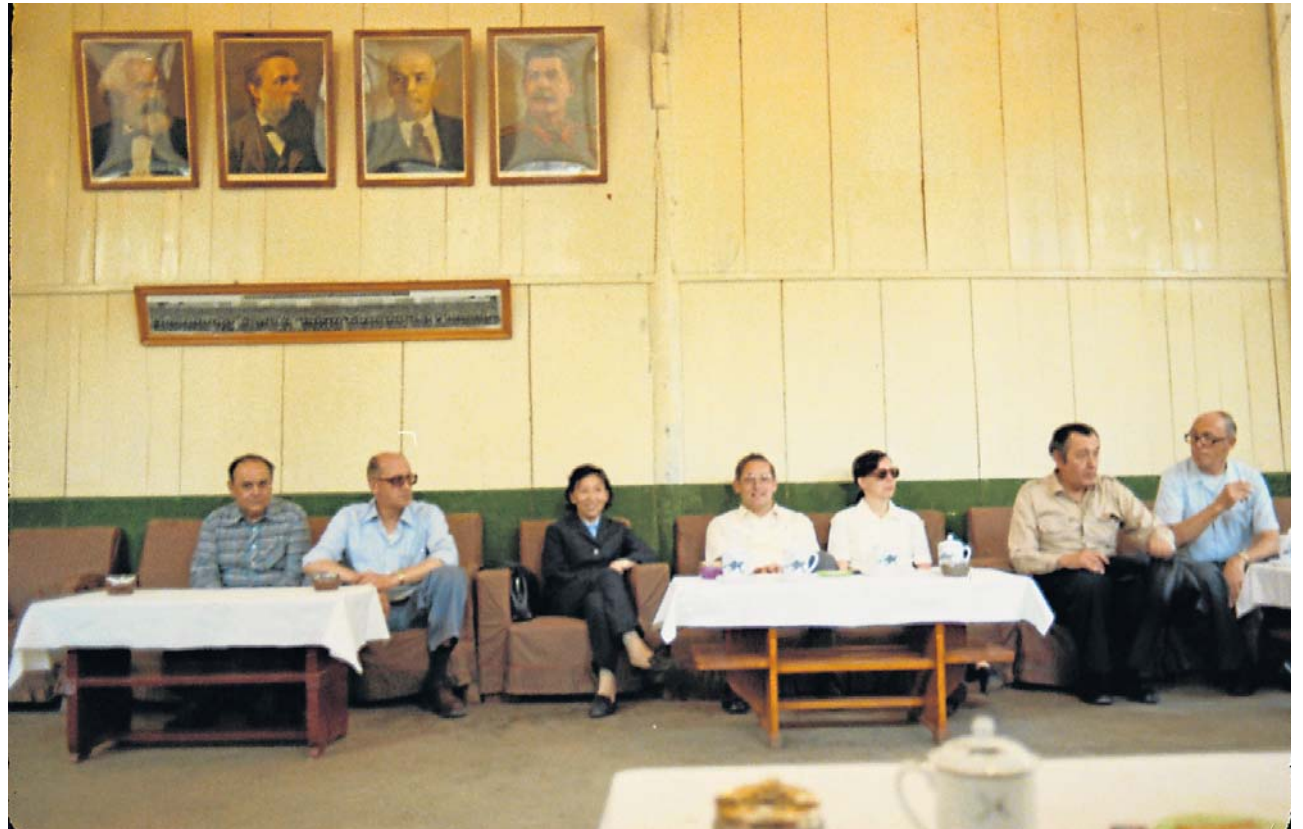
Une partie du groupe luxembourgeois lors d'une réception.

Où que nous arrivions dans la vaste Chine, on nous demandait: «Et comment va Monsieur Franck?» Il est certain qu'il a beaucoup contribué au