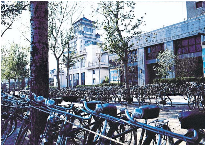
Parking de vélos sur un boulevard de Pékin.