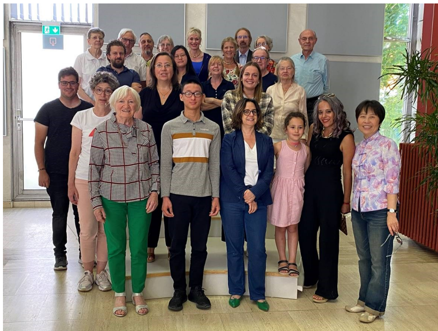
Photo prise lors de la remise des diplômes au Lycée Technique du Centre, le 8 juillet 2022.

Nos cours 2021/2022 sont désormais arrivés à leur fin. Nous remercions vivement tous les participant-es d'avoir choisi ACCL pour apprendre la langue chinoise, l'histoire, la calligraphie, l'aquarelle chinoise et la méditation Chan.